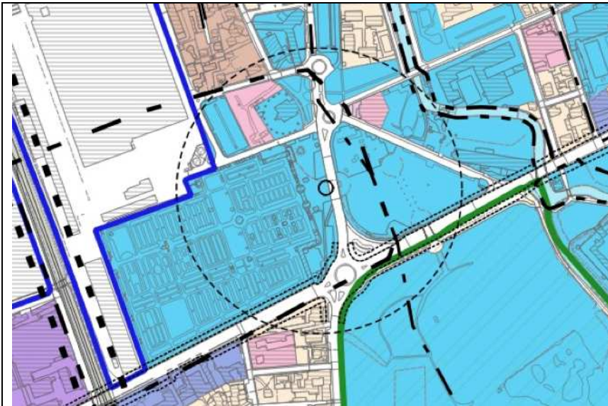
pozzo in piazza Cimitero